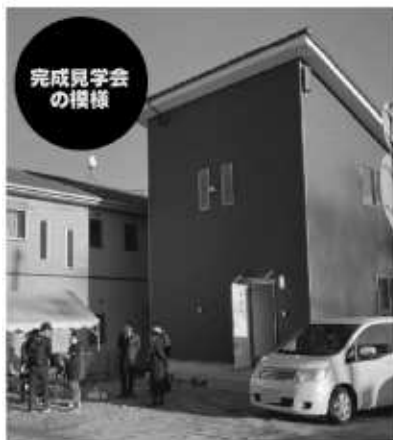
完成見学会 の様子

賃貸（収益）物件としても優れたコストパフォーマンスを実現！ 不動産投資のプロが考えた「ハッピーマイホーム」誕生！