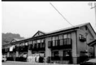
当社にて即金買取物件の一部

法人様所有の物件で、長年当社とはお付き合いがございました。この度、所有者様が新事業を始めるにあたり、その資金作りの為に当該物件の売却を当社にご相談いただきました。20年もの長いお付き合いのある所有者様でしたので、喜んで当社で即金買取をさせていただきました。