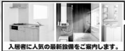
入居者に人気の最新設備をご案内します。