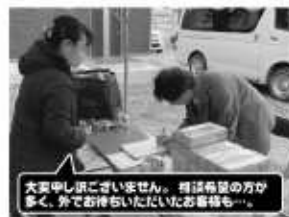
大変申し訳ございません。相談希望の方が多く、外でお待たせいただいております。