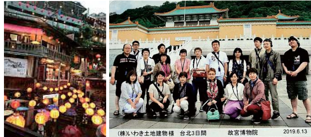
(株)いわき土地建物様 台北3日間 故宮博物院 2019.6.13