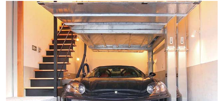
ケース④～ガレージ付き物件～ 愛車と共に生活できるお部屋