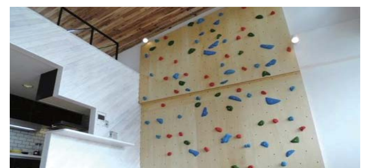
ケース⑥～ボルダリングができるお部屋～ 壁一面を改装し特徴的なお部屋に