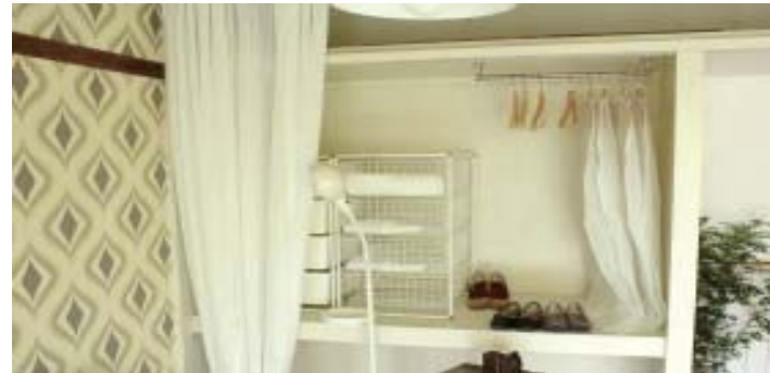
ケース③～DIY可能なお部屋～ 入居者自身で押入れをオープン収納へ