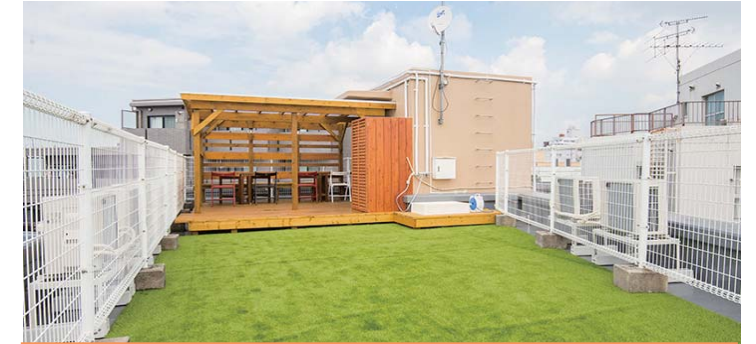
ケース②～ペット共生型物件～ 屋上スペースをドッグランに