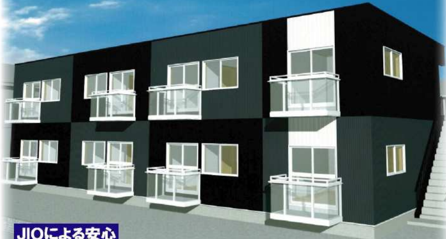
※完成イメージ画像です。