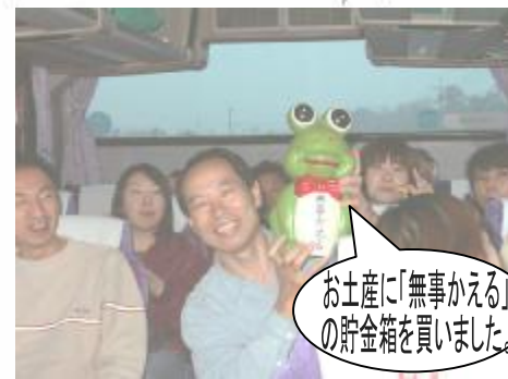
お土産に「無事かえる」の貯金箱を買いました。

今後、年2回の社内旅行を企画しておりますが、オーナーの皆様にも今回引き続き振って御参加いただけましたら幸いです。考えております。